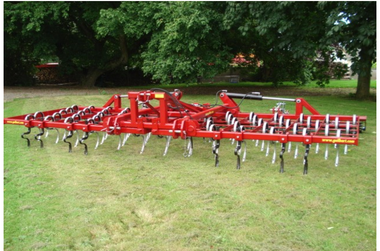
Dent Kongskilde montées d'origine Plats supportant les dents en 50x12 S355